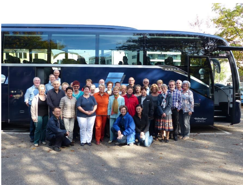
Stärkster Club: The Survivors, mit Bus angereist.